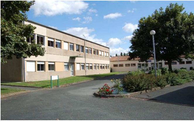
Collège François Viète